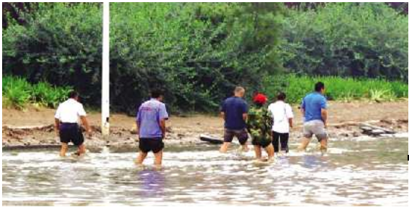
市民下水捞车牌。

本报泰安 8 月 2 日讯 (见习记者 王世腾) 2 日,一场阵雨过后,在泰玻大街和龙潭路交汇处的积水路段,几位货车司机想出了下水捞车牌的生财之道。