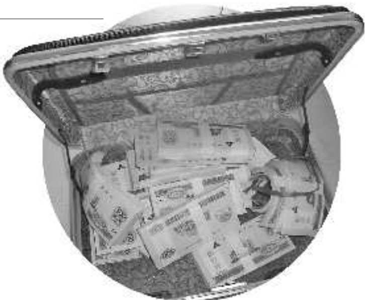
◀仅上面两张钱的,其余的都是。

女士长袍 7月 一手提箱 打开给王 里的东西,是两沓崭新的人民币。该男子说这钱是用于为王女士买房子用的,一共20万元,先放到王女士这里,王女士听了很感动。第二天,该男子打电话对王女士说要交房款定金5万元,让王女士从手提箱里拿出5万来给他。王女士一看手提箱上有锁自己打不开,该男子说自己拿着钥匙忘了给王女士,让她先筹5万给他。王女士想一