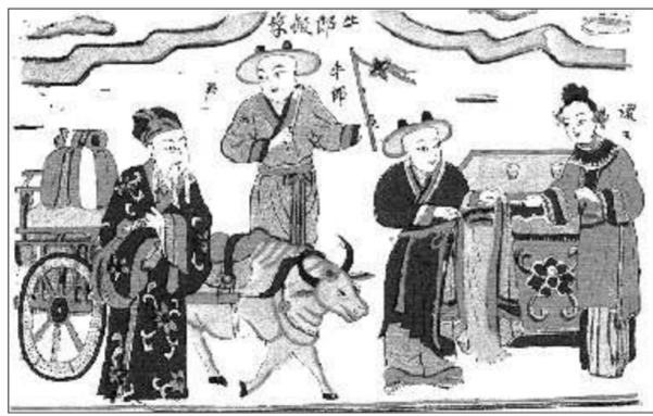
▲图6 杨家埠年画《牛郎搬家》