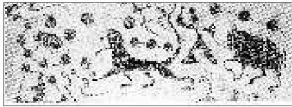
▲图1 河南南阳牵牛织女星