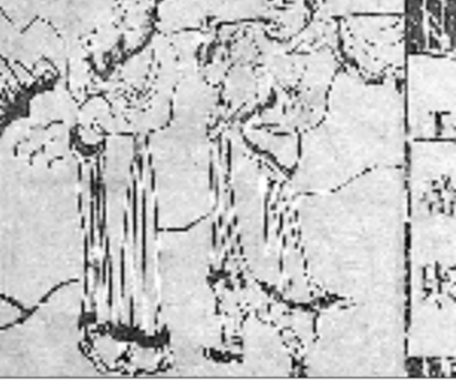
▲图4 潍坊杨家埠年画《牛郎织女》