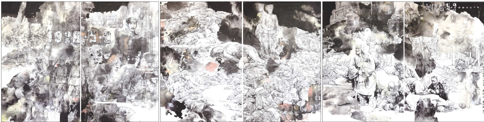
▲济南五·三惨案系列之一、二、三(岳海波、李兆虬合作)