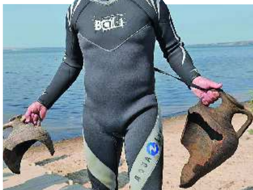
▲普京拿着发现的宝物。 ▲普京准备潜水。