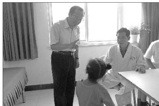
院门诊看望专家,并与就医者交谈 东营市副市长王吉能到市人民医

东营市副市长王吉能去市立医院专家门诊看望了专家。在泌尿外科,王副市长对专家丁克家说,专家不光是来给病人看病,还要给医生指导帮扶。看望完专家后,王副市长和市卫生局局长孙庆九、市人民医院领导进行了座谈,对如何提高社会群众、医院职工对公立医院改革的支持提出指导意见。“提高医疗水平是赢得社会支持的核心举措。”