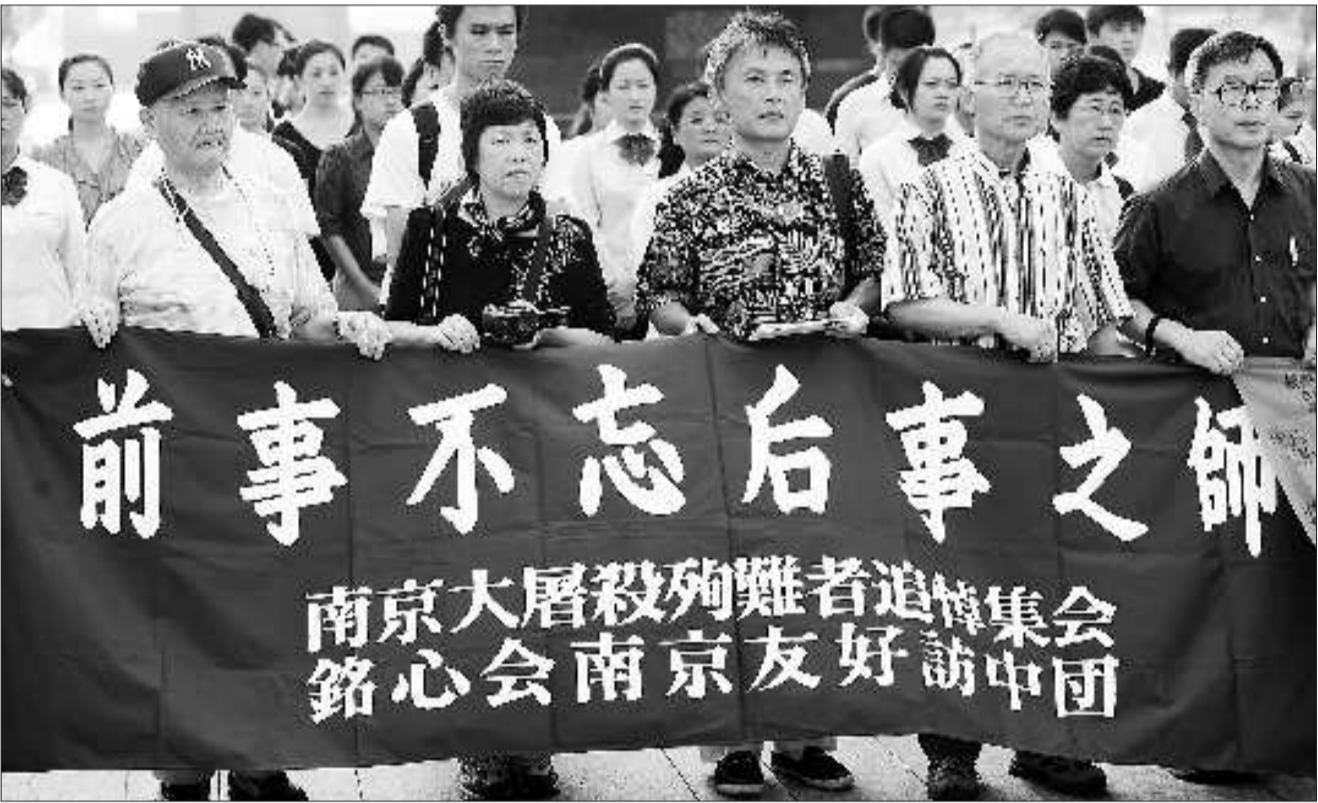
8月15日,南京各界人士百余人和日本友人在侵华日军南京大屠杀遇难同胞纪念馆举行和平集会,纪念中国人民抗日战争胜利66周年,祭奠30万南京大屠杀遇难同胞。

1945年8月15日,当时的日本天皇裕仁宣布日本无条件投降。1982年4月,日本政府决定将8月15日定为“追悼战死者祈祷和平之日”。从1963年起,日本政府每年8月15日都举行“全国战死者追悼仪式”。