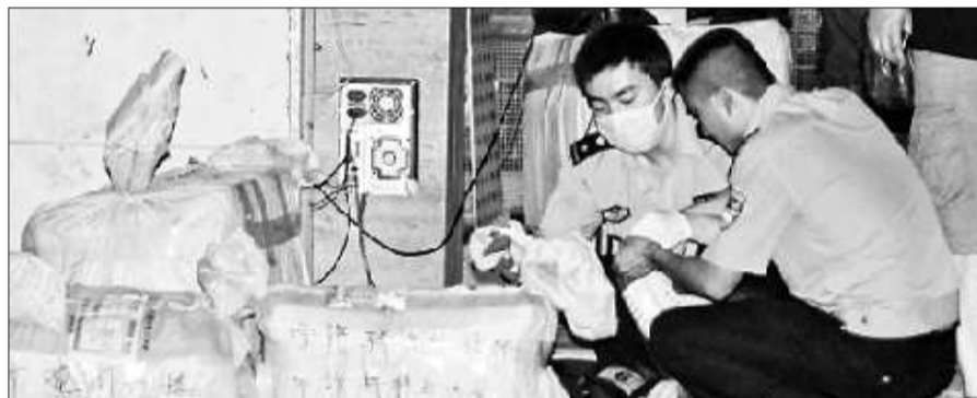
警方正在爆炸现场收集线索。(资料片)