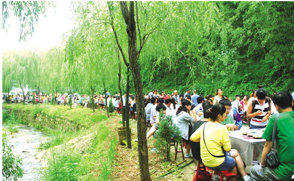
外出旅游,特色美食对目的地的选取发挥着重要作用。图为重渡沟万人农家宴。

食则有着地道的农家特色,不管是榛菇炖本地鸡、野菜山鸡蛋、煎饼小河虾、金玉满堂、虾酱窝头,还是葱油鲤鱼、肉沫木耳、香辣野兔、九如鸭煲,都让人一听名字就食欲倍增。金象山乐园以“欢乐王国”之美誉而备受青睐,这里有电动船、CS激光野战、世纪飞碟、宇宙飞车、龙卷风、鲨鱼岛、4D影院、海盜船、迪斯科大转盘、碰碰车、太空飞行、飓风飞椅等大型游乐项目,在金象山您将品尝到油淋豆腐、蒜子烧肉、山珍丸子、麻辣鲤鱼、京酱猪肝等特色美食。章丘白云湖的水上餐厅是一个绝好的去处,美食主要在河鲜和荷叶上做文章,有荷叶饺子、荷花沾蜜、炸荷叶包肉、美味清炖大雁鹅、荷花酒、荷花茶、荷叶茶等。