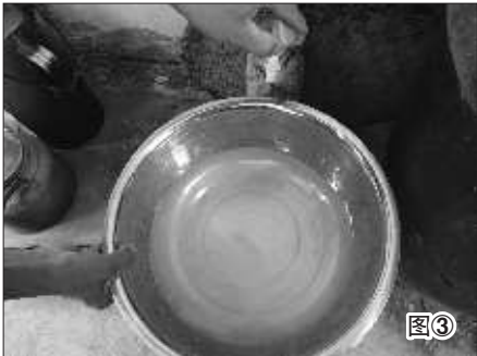
图①：发红的污水 图②：污水塘中的自来水管 图③：刚接的自来水