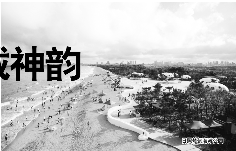
日照梦幻海滩公园

20日,本报《玩周刊》“走读休闲汇”系列走到了日照一站,历时两天时间,感受了浪漫的梦幻沙滩、前卫的迷笛音乐节、充满乐趣的赶海拾贝和颇有嚼头的《日出先照》,同时,更读出了这座海滨城市特有的文化与风情。