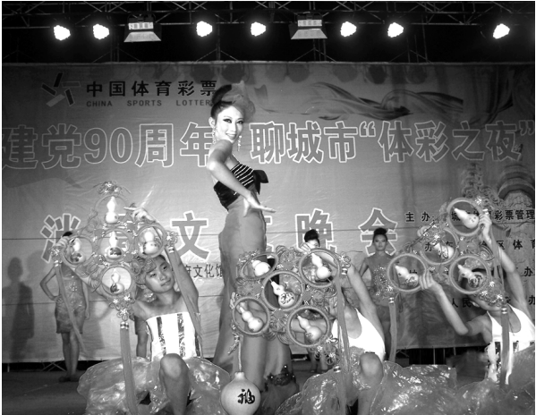
8月15日，为庆祝建党90周年，丰富百姓业余文化生活，由聊城市体育彩票管理中心主办的“体彩之夜”消