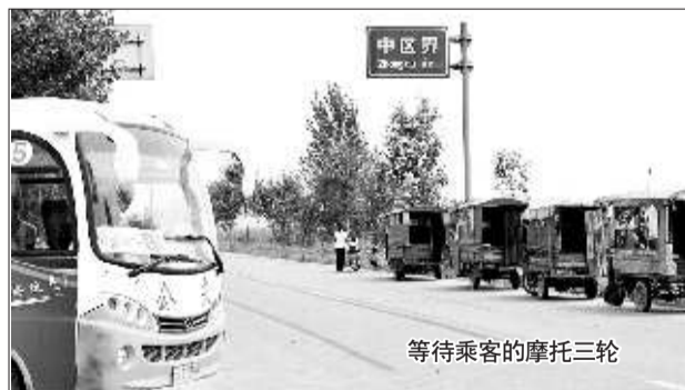
等待乘客的摩托三轮

济宁公交公司营调处的工作人员表示,目前城乡公交一体化还处于探索阶段。济宁25路公交车和嘉祥公交车的换乘问题,可以在官白庄设立公交换乘枢纽,让嘉祥与济宁市区的公交在此对接。“但具体何时能实现对接,目前还不好说。”