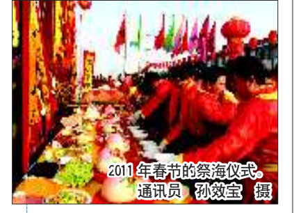
2011年春节的祭海仪式

经过十多年的打拼, 孙效宝有资本了, 于1999年买了羊口港上的第一艘小型钢壳船, 自己只需出船钱, 然后雇人出海。