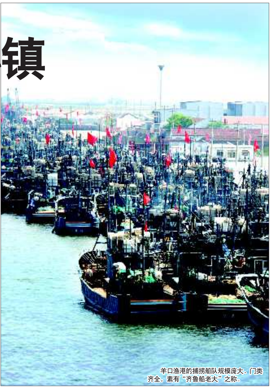
羊口渔港的捕捞船队规模庞大, 门类齐全, 素有“齐鲁船老大”之称。