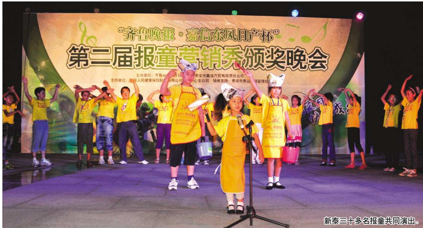
新泰三十多名报童共同演出。

本次活动还设置了现场抽奖环节,泰安市嘉信汽贸有限责任公司和泰安横店电影城特意为报童准备了精美的礼物和电影票。