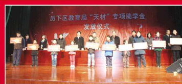
民辦為民 回饋社會