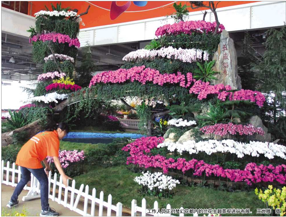
工作人员正对梦幻花都内的兰花主题景观进行布展。