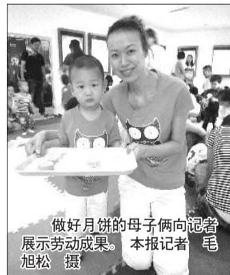
做好月饼的母子俩向记者展示劳动成果。

本报9月11日讯(记者 毛旭松 实习生 马可) 在中秋节来临之际,烟台世茂影城携手金宝贝早教中心在影城大厅举办欢乐中秋派对。25个家庭动手制作月饼,活动现场热闹温馨。