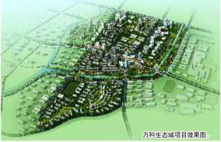
万科生态城项目效果图。

坚持把城中村改造作为释放发展空间,完善城市功能,转变发展方式的关键举措和重要载体,作为改善人居环境,缩小南北差距的主要途径,生态商住区内25个城中村现已完成回迁安置7个。回迁安置的李家上流城中村改造项目是青岛市2009年重点“两改”项目之一,比邻2014青岛世界园艺博览会园区,连接金水路商贸产业带、李村河休闲产业带,总面积约95亩,惠及社区居民1200余户。在整个片区的安置区建设过程中,始终坚持高起点规划,高标准建设、高效能管理,始终坚持“为老百姓盖高质量的房子”,作为居民回迁安置小区其建设品质在国内居于一水平,人车分流,户户观景,硬件建设做到了生态、环保和节能,配套设施齐全,软件建设实现了数字化、信息化和网络化。截至目前,世园会周边区域共有大型房地产在建项目14个,绿城理想之城、伟东幸福之城、春和景明、青山绿水、和达和城、山河城等一批高品质房地产项目已初见形象;万科生态城、新海园米罗湾项目已全面开工。这些改造开发项目无一不定义着大青岛的未来居住形态,诠释着新都市主义规划理念,随着世园会的不断临近,城区配套逐步完善,将带动区域价值不断成长,宜居宜商的生态商住区,必将成为青岛的又一张城市靓丽新名片!