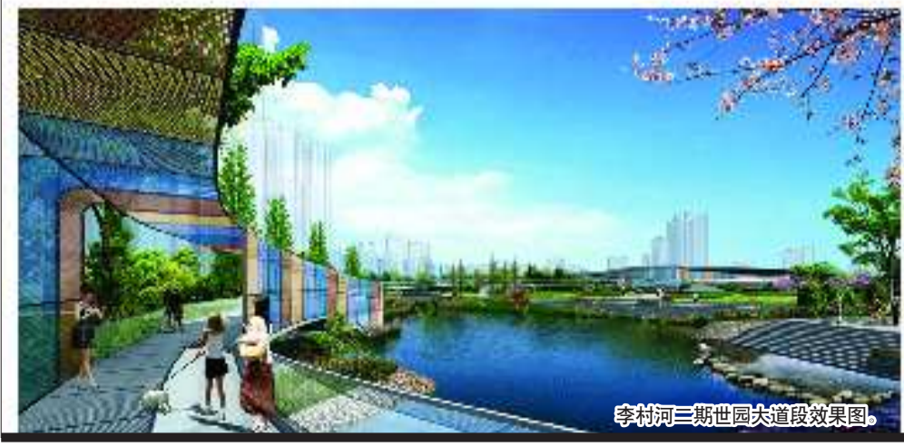
李村河三期世园大道段效果图。