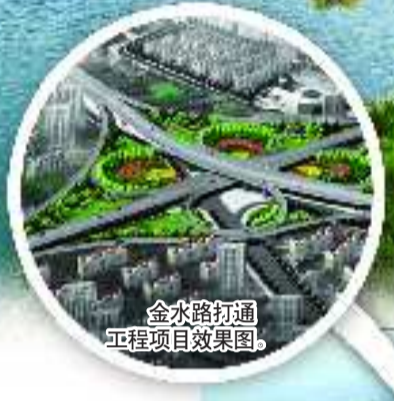
金水路打通工程项目效果图。

9月29日上午,李沧区李家上流社区城中村改造项目居民回迁安置启动仪式隆重举行,总建筑面积12万平方米的安置房全部建成并投入使用!李家上流社区成为世园会园区周边区域第一个回迁安置的社区。近年来,李沧区委、区政府紧紧围绕青岛市委、市政府“建设宜居青岛、打造幸福城市”的目标,坚持以世界眼光谋划未来,以国际标准提升工作,以本土优势彰显特色,围绕“拥湾枢纽、生态商都”的发展定位和“一极两轴三区四带”的战略布局,发扬“诚信实干、奋勇争先”的李沧精神和“三上”、“三要”的工作作风,凝心聚力,埋头苦干,经济社会发展和城市建设不断取得新的突破。特别是2014青岛世界园艺博览会花落李沧,为李沧东部的发展带来了前所未有的重大历史机遇,为此,李沧全区上下正在全力推进“迎办世园会、建设新李沧”三年大发展行动。