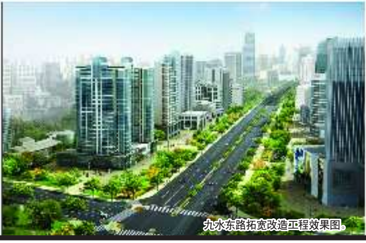
九水路拓宽改造工程效果图。