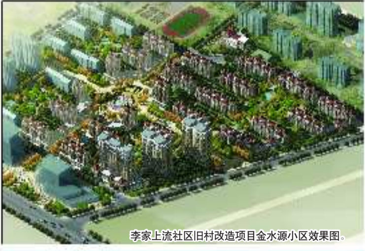
李家上流社区旧村改造项目金水源小区效果图。