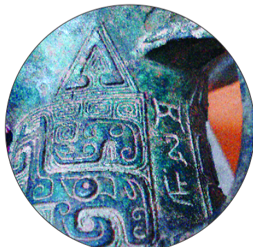
▲仿商代青铜觥，铭文死板，文法不对。