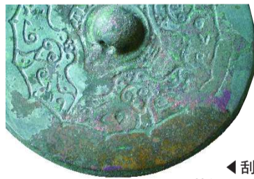
▲刮去绿锈后的红斑不自然。

宋代的仿品，主要是材料与商周青铜器不同，用的是宋代当时的材料，明显的特征是铜质暗红，较软，铸造方法上用的也是宋代的技术，蜡模铸造，无范线，但是经历千年的铜锈和包浆是真实的。“宋代人在仿制的品种上，主要仿商周礼器，很少见到仿战国、秦、汉代的素器，也不仿制兵器、车马器等。”张頌斌说。