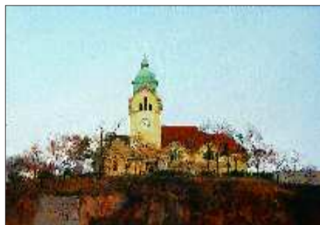
▲《青岛基督教堂》 徐青峰

浓厚的收藏意向。在法期间,中方代表还会见了著名海外华人艺术家朱德群先生和赵无极先生的夫人,并对两位艺术家在山东举办个人画展表示了衷心的期望。