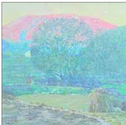
▲《百花峪的早晨》 王力克