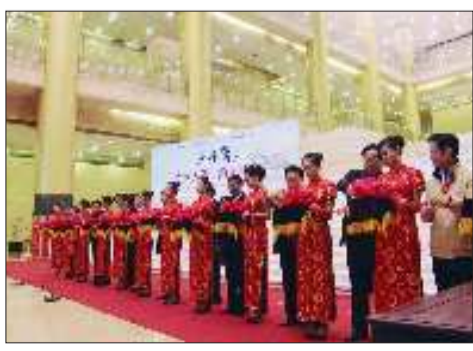
参加本活动的有关省市领导