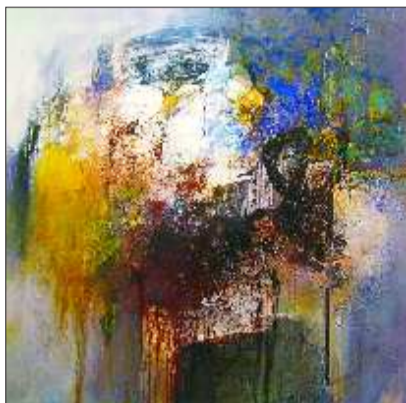
▲《城市的激情》 王衍成