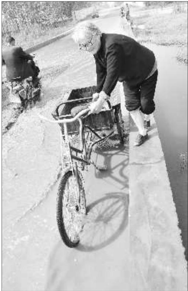
一名村民挽起裤脚,推着三轮车踏在窄窄的桥沿上,小心翼翼地前行。