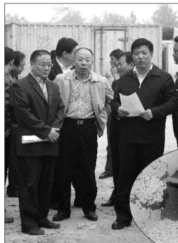
菏泽市副市长刘新云(右一)到施工现场查看工程进度。

针对刘新云提出的指导性意见,工程指挥部当即召开现场会予以落实。截至9日20时记者发稿时,工程指挥部成员仍在工地一线工作。