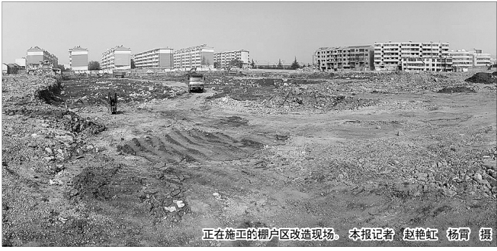
正在施工的棚户区改造现场。

本报枣庄10月9日讯(记者赵艳虹 杨霄) 9日,记者从有关部门获悉,市中区杨河、辛庄、陈庄、大官庄棚户区征收改造项目均已正式启动,各工程项目已开始进行基础开挖。