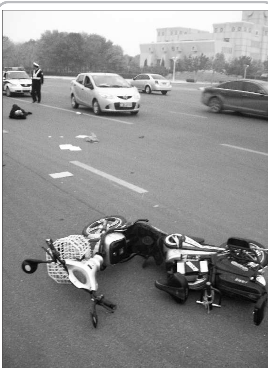
老人的电动车被撞出了几米远。