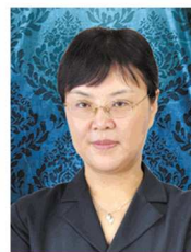
国内微雕注射创始人