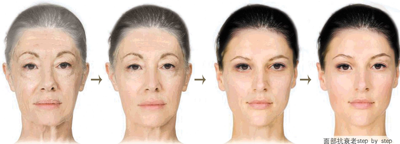
面部抗衰老step by step