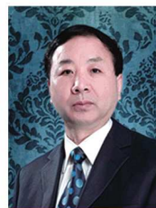
细胞疗法首研开发者