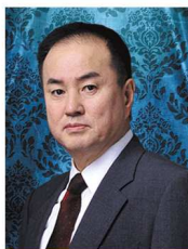
韩籍口腔颌面抗衰老专家