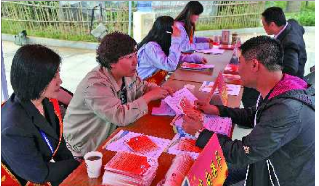
在历山名郡小区,工作人员现场解答市民关于水、气、暖方面的问题。

在此前进社区活动中,济南港华为君逸左岸社区、县西巷社区开通了天然气;舜玉南区、剪子巷等坑洼路面得到修补。在尚未办结的问题中,多数是加入集中供暖等一时难以解决的问题。“暂时无法解决的问题,也不能石沉大海,我们会将其列入工作计划,待条件成熟时再逐步解决。”贾玉良说。