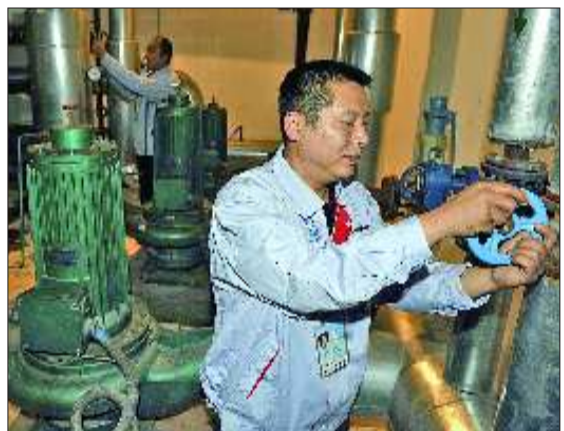
23日,在历山名郡小区,济南热电的工作人员正打压试水。

对此,济南热力有限公司相关负责人表示,市政公用事业局下属的供热企业,正在努力收回自管站,目前济南市800多个自管站,已经收回了300多个。对于新天地小区自管站,热力公司已经跟该自管站谈过,目前已经开始施工,按照相关要求,等供热设施以及二次管网改造合格后,就能收回。