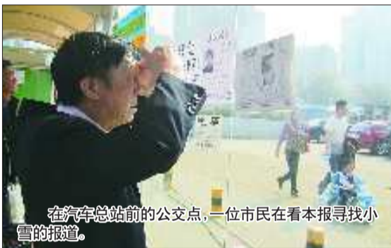
在汽车总站前的公交点,一位市民在看本报寻找小雪的报道。