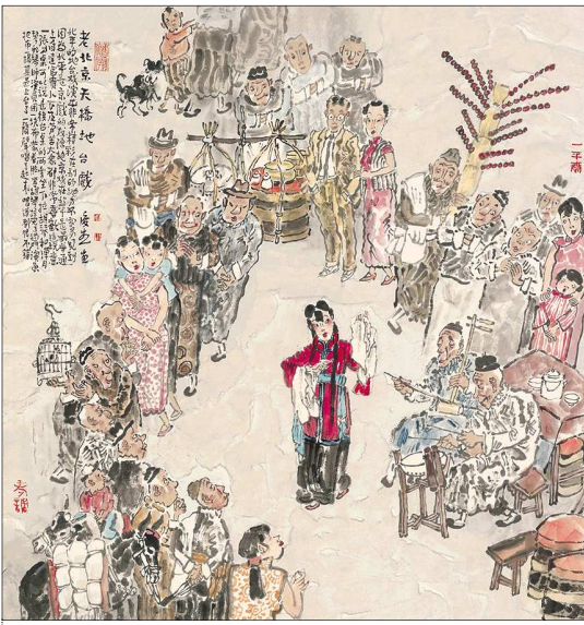
◇老北京天桥地台戏 68cmx68cm