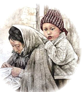
▲春分布托 136cmx68cm 局部

◆张:是的。我痴迷于艺术,并将它视作自己的“令爱”。作画不仅是在描绘生活中的人物、事物,也是在审视自己的内心。笔随心走,心为笔牵,创作时我会全身心融入,将自己化作画中之人。揣摩着心灵,推敲拿捏着形态,将人生经历、悲欢情感凝练倾注其中。这种创作动力很单纯,也只有这样才能让画作焕发出洗尽铅华的清爽和至真至美的光彩。(东野升珍)