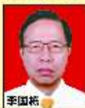
李国栋 主任医师 博士 全国肛肠学会主任委员