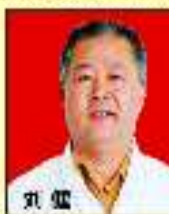
刘佩 主任医师 中国肛肠学会理事 中国肛肠学会理事