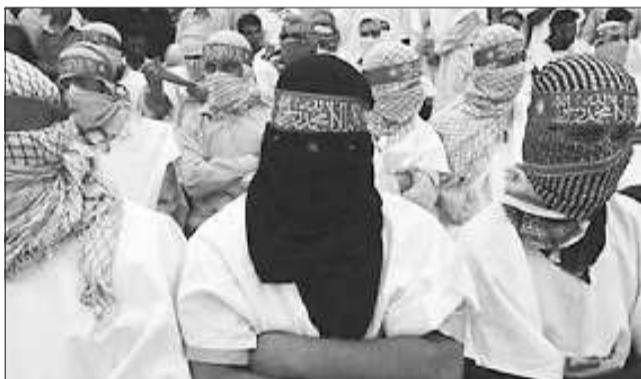
伊朗的“人弹部队”。(资料片)