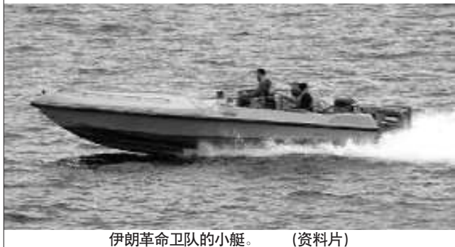
伊朗革命卫队的小艇。(资料片)