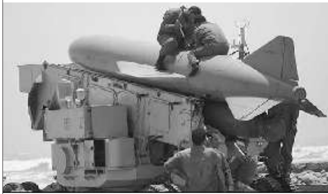
伊朗的岸舰导弹。(资料片)