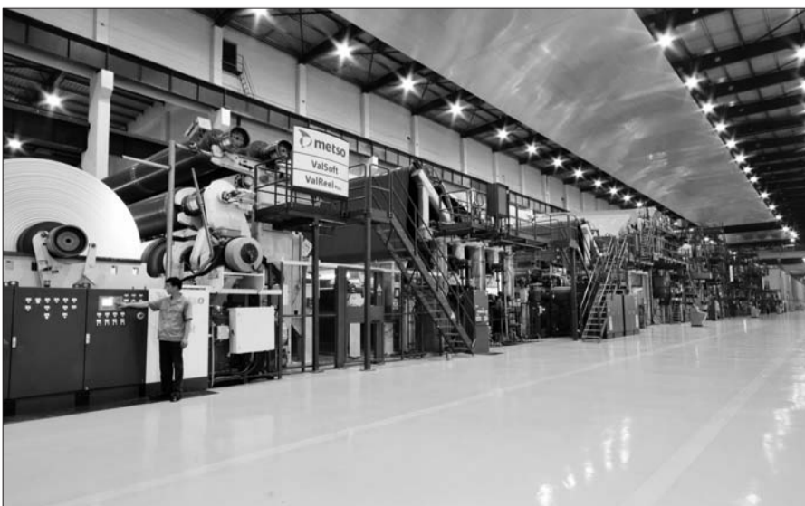
太阳纸业现代化生产车间。