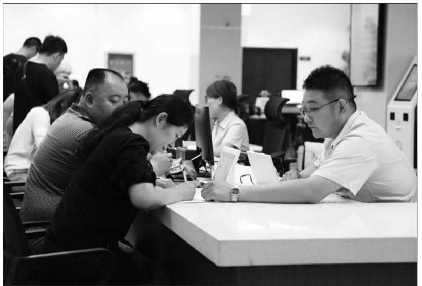
为民服务中心,为市民提供一站式服务。