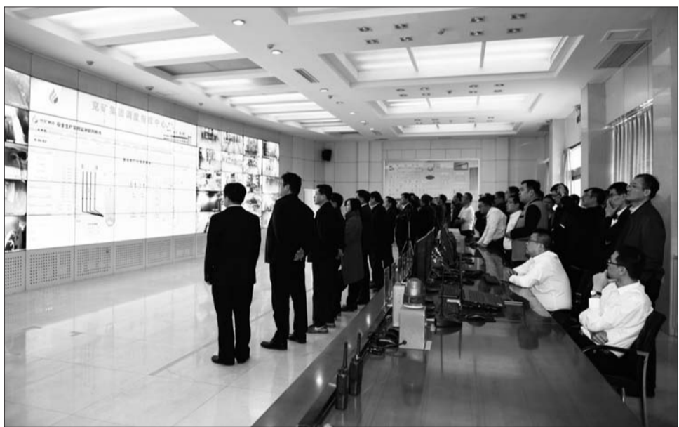
兖矿集团调度指挥中心。

从2001年兖州矿业ERP一期上线,在煤炭行业最早使用SAP ERP,到2019年完成总体规划,ERP全覆盖一期上线,初步建成两个“三化”示范矿井。20年来,兖矿集团在数字化建设的道路上走出一条颇具特色的“兖矿之路”。兖矿集团信息化中心主任、北斗天地股份有限公司董事长、总经理张元刚一言概之:“数字赋能,智慧兖矿。”