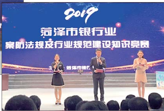
▶2019年菏泽银行业案防法规及行业规范建设知识竞赛开赛。

为进一步筑牢辖区银行业规范发展基础,强化风险防控基本,巩固乱象整治成果,培育良好合规文化,10月30日,由菏泽市银行业协会主办的“2019年菏泽市银行业案防法规及行业规范建设知识竞赛”在定陶区电视台成功举办。