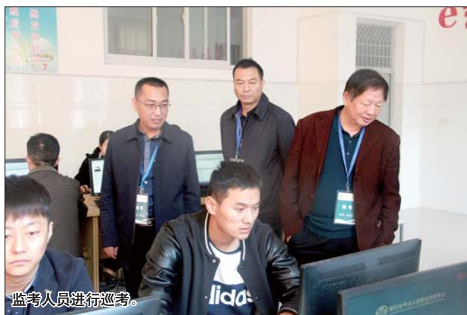
监考人员进行巡考。

为做好此次考试,银行业协会协同考点学校及ATA公司督考人员,建立了联动机制,制作了醒目的考场示意图、考场索引和考生守则,营造了安全有序的考试环境。考试期间,协会秘书处统筹分工,细化责任,对各考场进行实时监控、巡考,考场秩序井然,为考生营造了良好的考