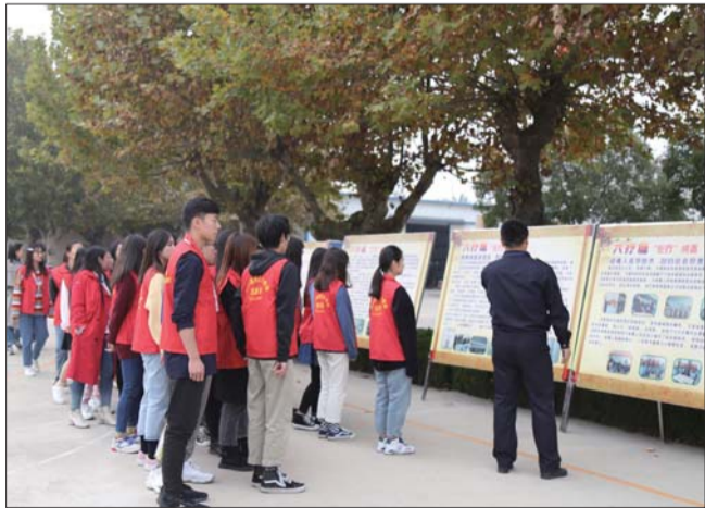
40余名师生学习禁毒知识。

随后,大学园师生一起走进济宁市强制隔离戒毒所,在实地参观过程中,通过工作人员的介绍,师生对毒品的危害有了更深的体会。“特殊讲堂讲信念”“戒毒人员学技术”……一个个图文案例,让现场不禁沉思。“出入各类场所一定要小心,谨慎交友,远离毒