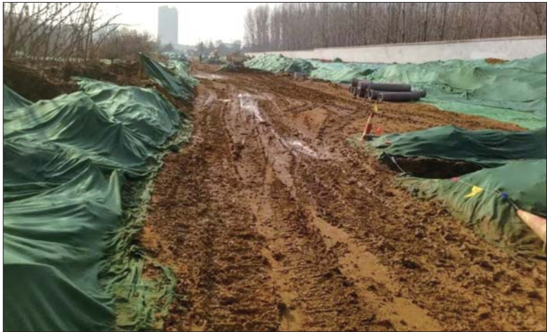
遇到重污染天气工地停工。

本报泰安1月2日讯(记者 郭健) 近日,壹粉向齐鲁晚报·齐鲁壹点情报站反映,泰山护理职业学院正门(东南门)共青团东街自2019年7月封闭施工近半年,至今没有修完。8000多名师生出入只能走西门,上下班时间拥堵严重。师生、过往行人和车辆需要经过铁路地下涵洞,穿过泰山大街,有安全隐患。