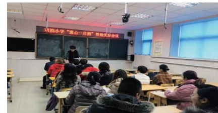
爱心一日捐 为进一步推动学校扶贫助困工作精准有效开展,近日,蒿泊小学开展了“爱心一日捐”活动。(赵晶)