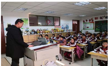
普法讲座 为增强学生的法制观念,预防未成年人犯罪,近日,新都小学举行“与法同行,为成长护航”普法讲座。(孙志红)