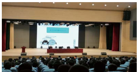
检察长进校园 近日,荣成市检察院党组书记等一行3人来到荣成一中为全校师生进行法制宣传。据了解,刘书记已被聘任为该校法制副校长。(许晓玉)