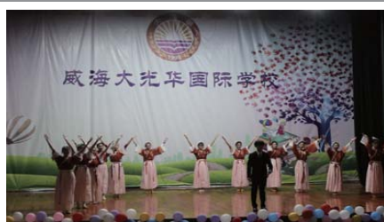
不忘初心 为深入推进“不忘初心、牢记使命”主题教育,近日,威海大光华国际学校高中部举行元旦文艺汇演,演出歌舞《不忘初心》等曲目。(闵珍珍)