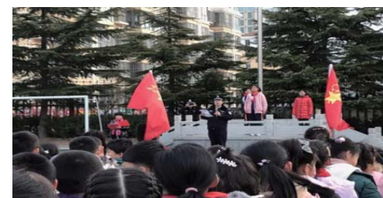
安全宣教 为了进一步增强师生交通安全法规意识,12月30日,蒿泊小学举行了“铁路安全知识讲座”。(刘娜 徐静)