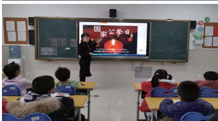
铭记历史 为增强师生爱国主义情感,近日,经区实验小学九龙湾校区开展了国家公祭日主题教育活动。(尹冰怡 李金鸣)