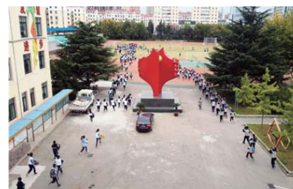
防震演练 为提高师生应急防范能力,近日,皇冠中学举行防震应急疏散演练。(于闪娜)