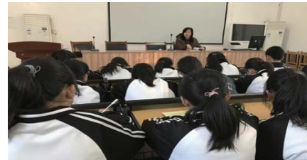
写作指导 为了促进学生爱读书、会写作的良好习惯。威海九中青禾文学社开展“写作指导”活动。(李敏)