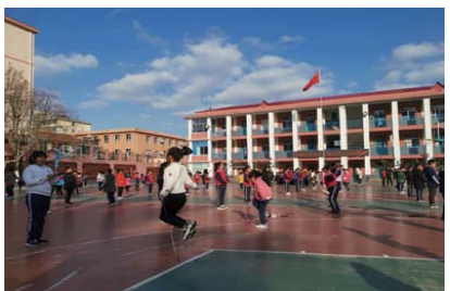
“绳”采飞扬 为倡导阳光体育健康运动,近日,南山小学开展“绳采飞扬绚亮花样年华”跳绳比赛。本次比赛分普及赛、花样赛及团体赛三个项目。(崔晓燕)