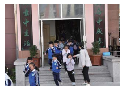
演练 为增强师生防震安全意识,近日,长峰小学开展了“防震安全疏散演练”活动。(王之伟)