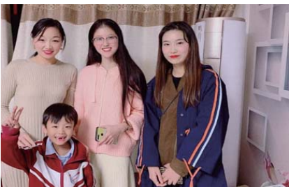
家访活动 近期,新都小学开展了为期两个月的“家校携手,共育新苗”百名教师访千家活动。老师们走进学生家中,认真听取家长和学生的意见和心声。(徐韶尉)