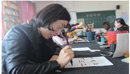
“墨香”校园 为提高师生书法学习兴趣,本学期,锦华小学多措并举抓实“师生练字”,积极打造“墨香”校园。(蔡永勤)