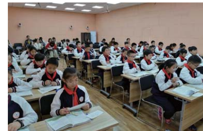
打造活力课堂 为深入课堂研究,促进学生深度学习,打造“活力高效课堂”,近期,凤林学校开展了为期一个月的全学科课例研讨活动。(陈雨辰)