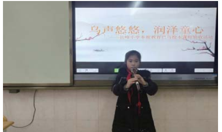
课程验收 为扎实推进特色办学,促进学生的全面发展。近日,长峰小学开展音乐学科技能评测活动。(许文颖)