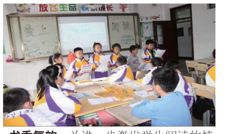
书香气韵 为进一步激发学生阅读的持续性,近日,凤林学校举行“读经典美文,话书香气韵”特色聊书活动。(许新颖)