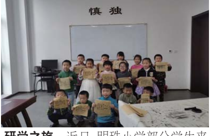
研学之旅 近日,明珠小学部分学生来到威海市图书馆尼山学院开启传统文化研学之旅。(陈琦)