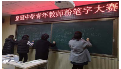
岗位练兵 为进一步提高青年教师的专业素质,近日,皇冠中学开展“岗位大练兵 铸皇冠之师魂”活动。(于娜)