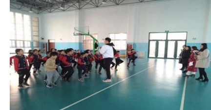
培训会 为进一步加强干部队伍建设,提高中层领导的管理水平,近日,温泉学校全体中层领导参加了“顶天立地做中层”培训会。