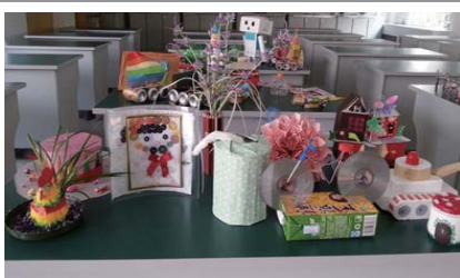
变废为宝 为提高学生低碳生活的环保意识,近日,蒿泊小学举行“巧手变变变 变废为宝”活动(陈彦羽)