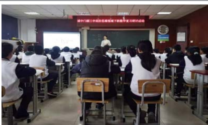
同课异构 为促进新教师的专业化发展,近日,城里中学和门源三中青年教师“同课异构”远程教学观摩研讨活动举行。(武刚)