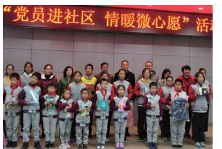
圆梦微心愿 近日,威海七中联合怡沁园社区等共建单位,开展了“党员进社区 情暖微心愿”志愿服务活动,帮助学生达成“微心愿”。(陈晨晨)