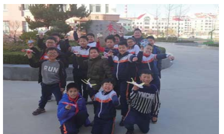
展风采 为充分展现学生社团活动成果,近日,长峰小学举行了丰富多彩的社团成果展示活动。(王倩玉)