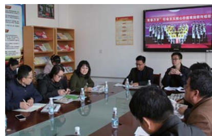
校级交流 近日,德州市齐河县中小学领导干部考察团来威海九中进行考察学习。期间,两校领导针对学校各项工作具体工作进行了深入交流。(于千千)