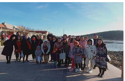
赏天鹅 近日,经区实验小学工会组织教职工前往荣成烟墩角天鹅湖,开展了“观天鹅 摄影 健身”活动。(孙文静 刘含笑)