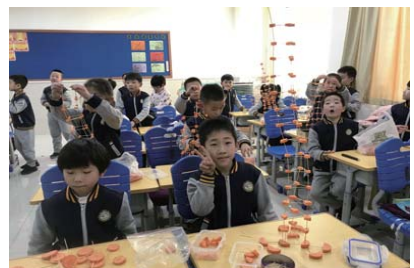
科技节 为培养学生的实践能力,近日,经区实验小学九龙湾校区举行了以“知在行动里,美在探究间”为主题的科技节活动。(王初梗 李金鸣)