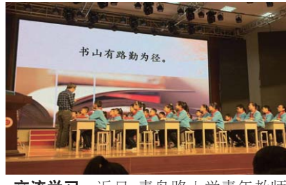
交流学习 近日,青岛路小学青年教师在校领导的带领下,来到潍坊青州云门书院双语学校参加全国著名特级教师统编教材精品课展示活动。(张华)