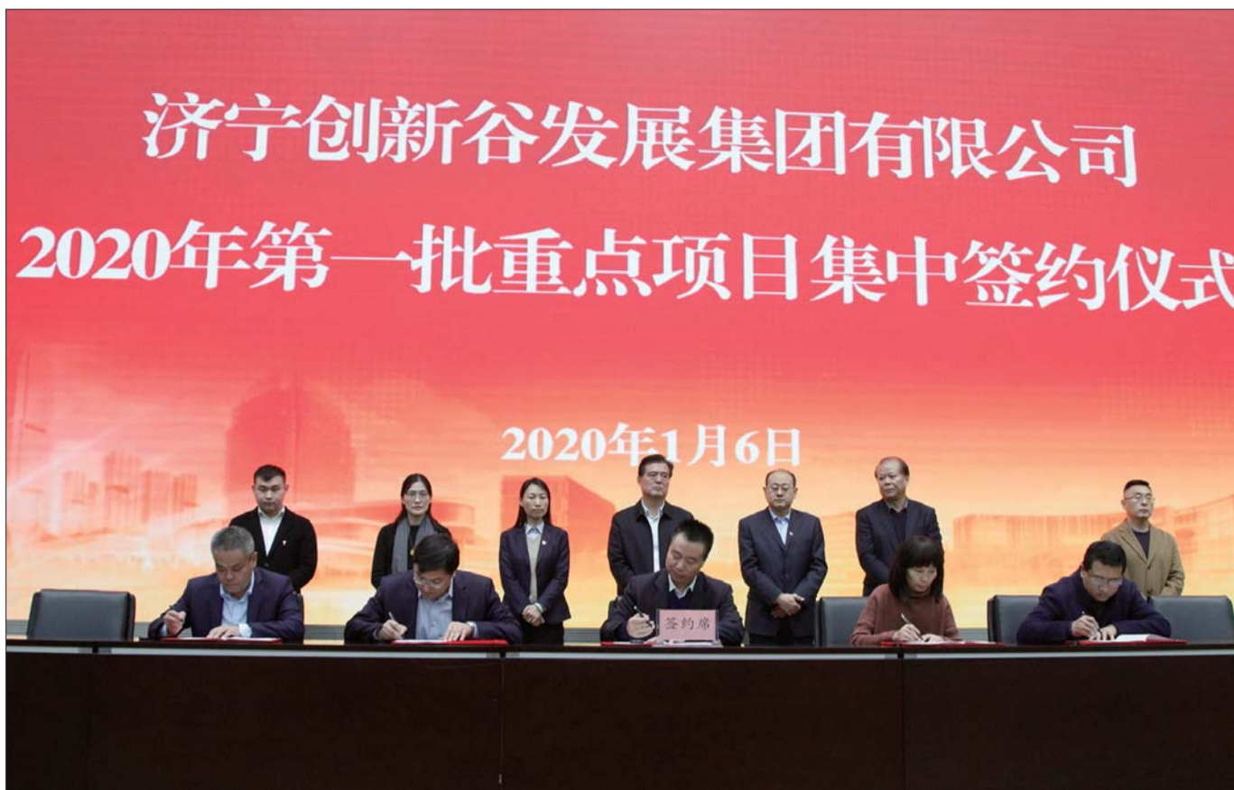
济宁创新谷集团2020年第一批重点项目集中签约。

本报济宁1月7日讯(记者 邓超 通讯员 寻广通) 1月6日下午,济宁创新谷集团召开2020年创新发展大会暨党建和党风廉政建设工作会,深入贯彻全区经济工作会议精神,以“不忘初心 牢记使命”主题教育为契机,动员集团上下解放思想,提升境界,扑下身子,埋头苦干,在服