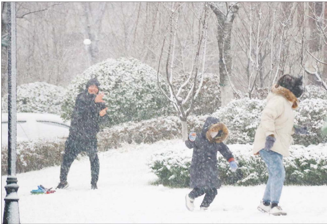
7日上午,在聊城振兴路一小区,居民冒雪打起雪仗,堆起雪人,一派热闹景象。