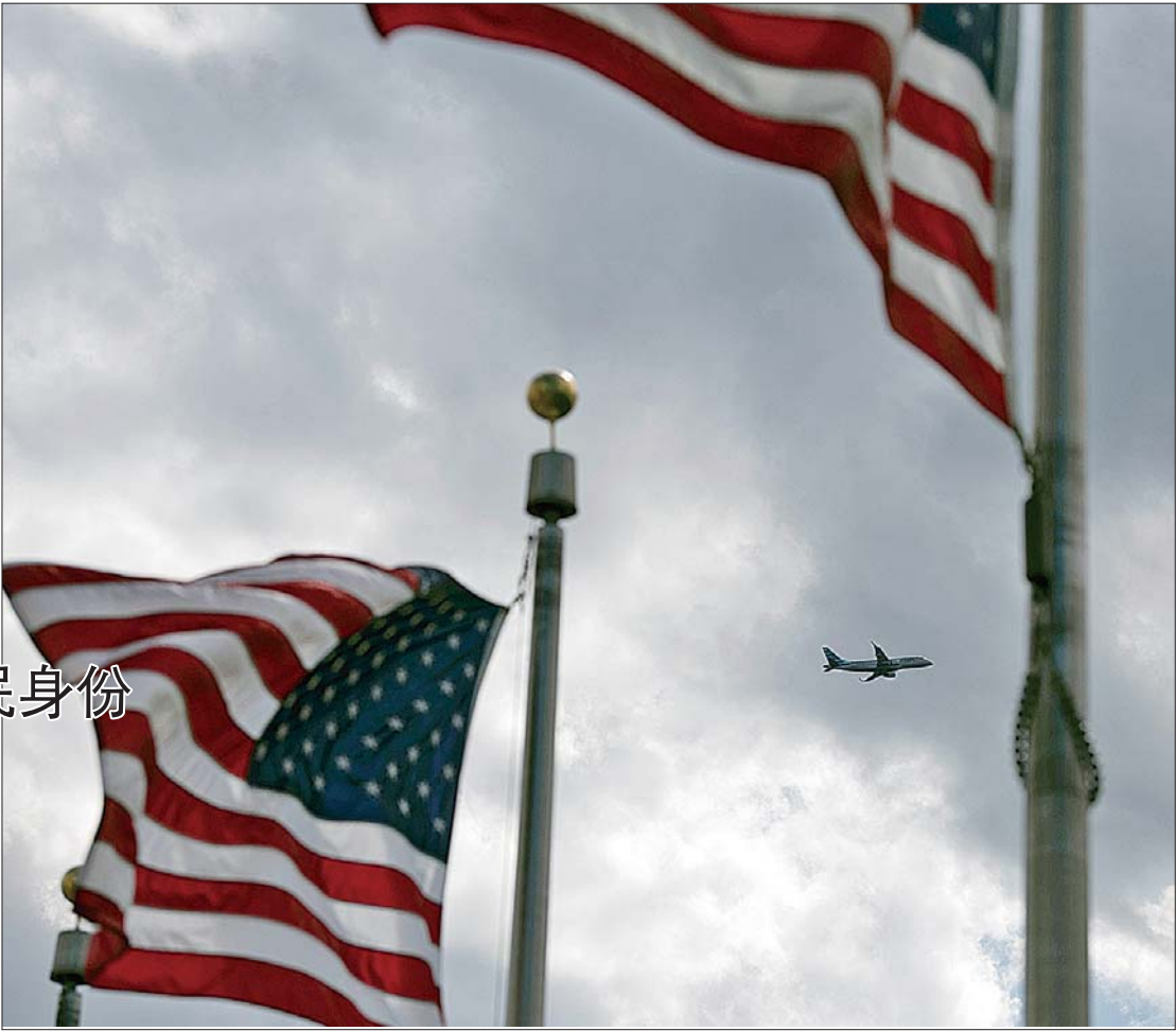
21日,一架飞机从美国首都华盛顿上空飞过。

美国针对疫情的社交疏离政策也已持续近一个月,经济大面积停摆,在截至4月11日的一个月间,全美首次申请失业救济人数已累计超过2200万。分析认为,这显示目前美国的失业率至少已达17%,远超2008年金融危机期间的数字。经济学家预计,今年第二季度美国