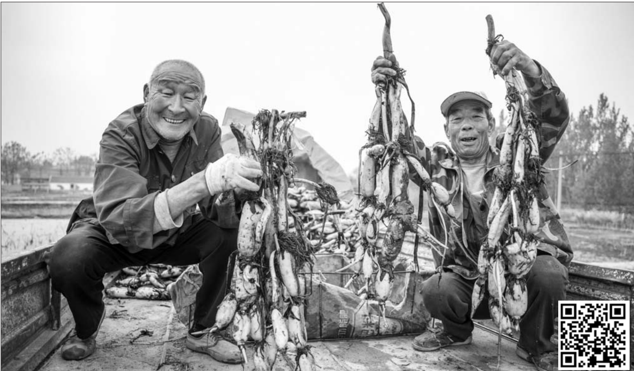
4月16日,曲阜市姚村镇庙东村村民在采摘莲藕。

谷雨时分,正值莲藕种植的黄金时期。在曲阜市姚村镇,藕池的挖掘、藕种的种植正进行的热闹。通过支部领办合作社联盟,庙东村以“庙东泉”无公害莲藕为龙头,抱团取暖,增加抗风险能力和服务能力不断增强,推动支部领办合作社由“单打独斗”向规范运作、“抱团发展”转变。