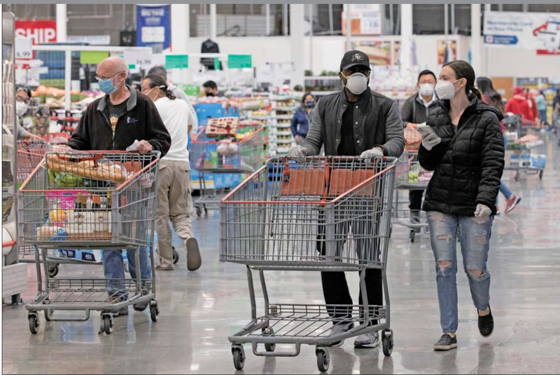
4月22日,市民戴口罩在美国北加州旧金山湾区福斯特城一家超市购物。

美国加利福尼亚州圣克拉拉县政府公共卫生部门最新发布的通报显示,早在2月6日当地就有人死于新冠肺炎,这比美国此前公布的首个新冠肺炎死亡病例早了20多天。此前,美国确认最早死亡病例是2月26日在西雅图地区的去世者。外媒称,这意味着,美国疫情暴发的时间表或将重新改写。