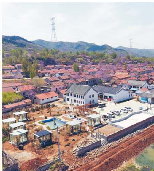
即将投入使用的当阳康养山居。