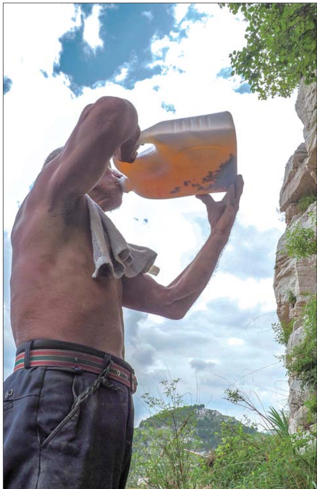
烈日炎炎,就靠从家里带来的这一桶水解渴。