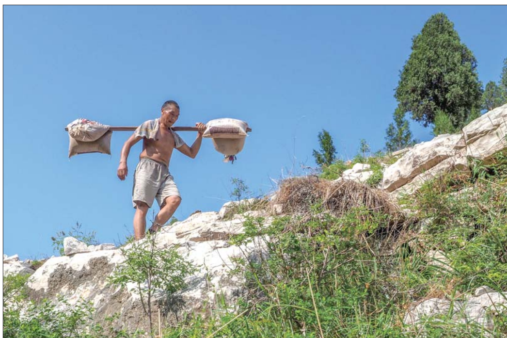
沙子、水泥、植树用土都要从山下挑上来。