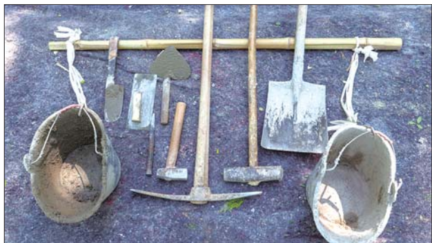
山高坡陡,施工机械难以施展,只能靠这些最原始的工具完成。