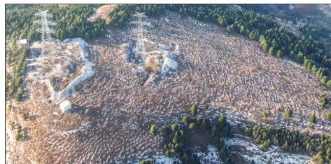
一个个鱼鳞坑和在其怀抱中的小树苗,是植树人的业绩,也记录着他们的艰辛。