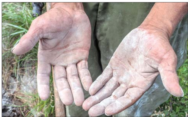
一双布满老茧的手是每个造“窝”植绿人的“标配”。