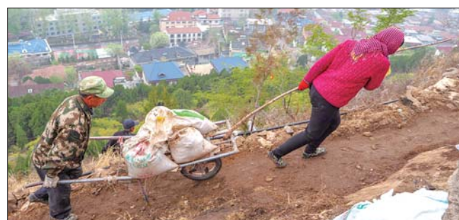
能上小推车,就算施工条件不错的地方了。