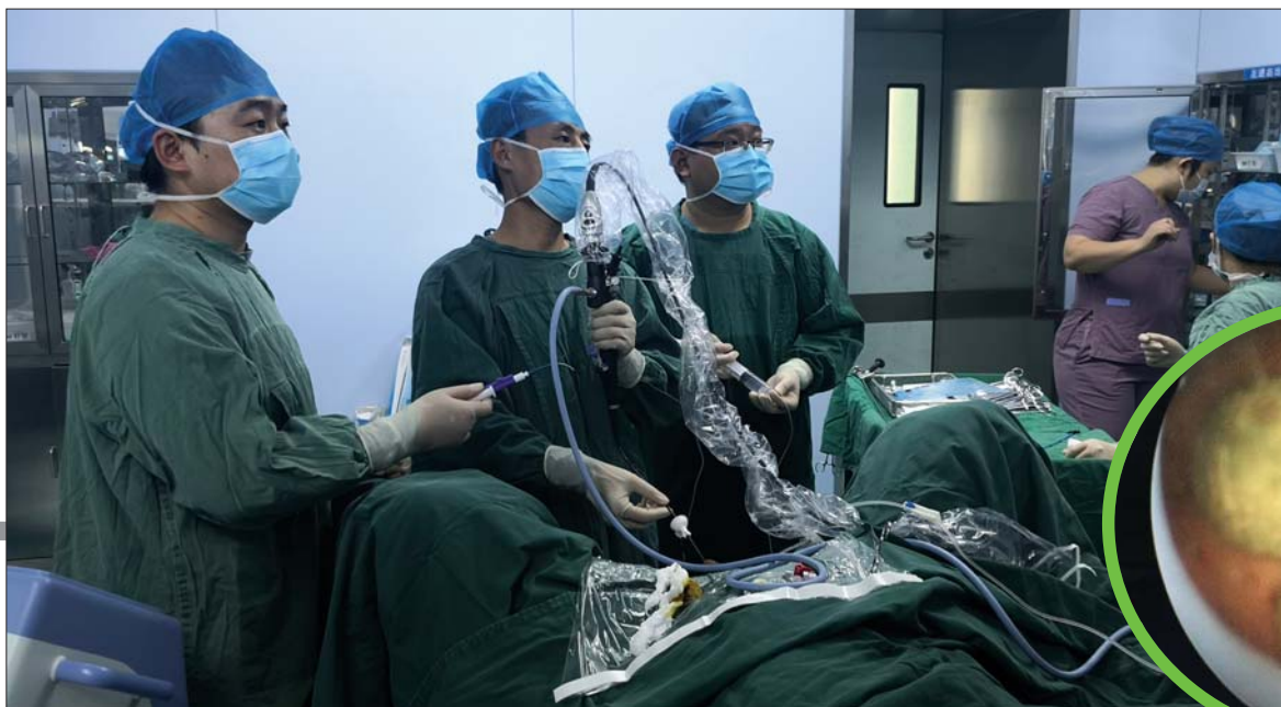
◀ 医生们在进行泌尿微创手术。 ▼ 手术取出的石头。

济阳区中医医院外二科是医院重点综合性科室,是以腔镜微创外科为主要治疗方向的特色科室,近年来,医院结合医院中医中药优势,形成了以泌尿外科、肝胆外科、胸外科、胃肠外科、两腺外科等多学科协同发展优势。外二科目前开放床位50张,共有医护人员22人,其中主任医师1人,主治医师3人、住院医师5人,医师力量和医疗资源十分丰富。