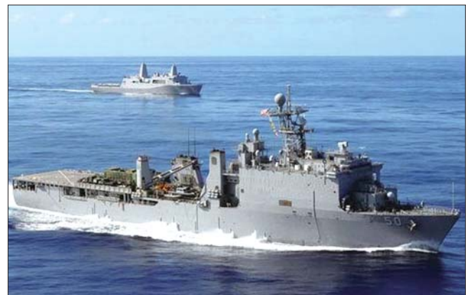
美国海军“卡特霍尔”号两栖船坞登陆舰

美国海军的“罗斯福”号航母和“基德”号驱逐舰都曾暴发疫情,但从4月30日起美国海军停止报告这两艘军舰的感染人数。美国国防部在一份声明中称,出于对战备状态下行动安全的考虑,不会公开单个单位、指挥系统或基本部门的具体感染人数。 据环球网