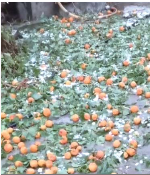
刚成熟的杏被冰雹砸落一地。