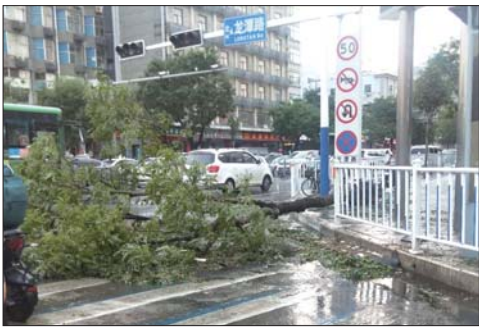
不少树被大风刮倒。