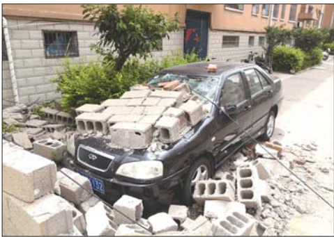
中悦城围墙倒塌私家车被砸。