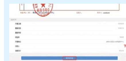
灵活就业参保人员查询电子票据信息步骤二。