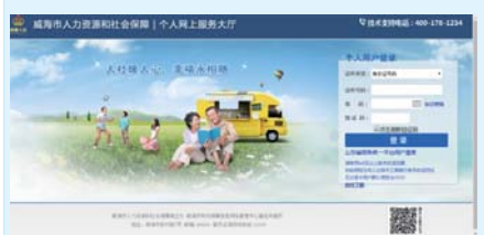
灵活就业参保人员输入账号和密码登录。