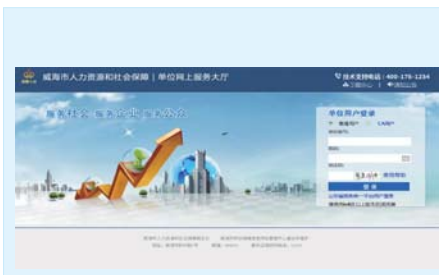
参保单位输入账号和密码登录。

五、票据查验 参保单位、灵活就业参保人员可以通过关注“山东财政电子票据”公众号(微信号:sdzczdjp),点击票据查验,选择“电子单号查验”或“扫一扫查验”扫描电子票据右上角二维码即可查询真伪。