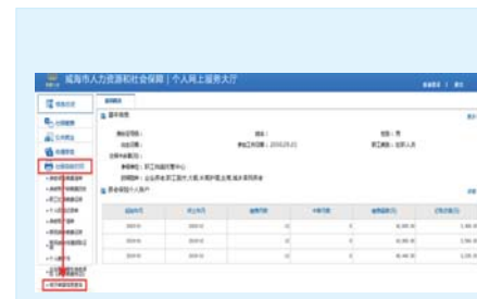
灵活就业参保人员查询电子票据信息步骤一。