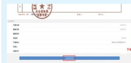
参保单位查询电子票据信息步骤二。