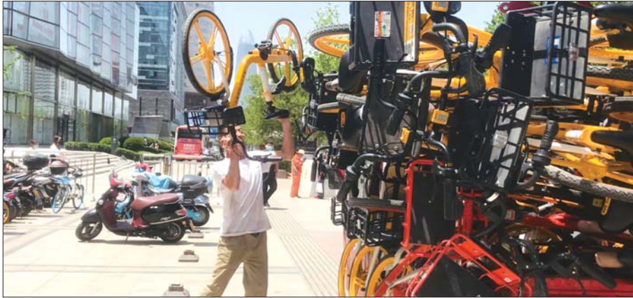
6月3日,共享单车公司工作人员正在清运泉城路上停放的单车。

作为济南最繁华的商业街,自明清开始,泉城路就是济南的商业和政治中心,它横贯于济南老城东西,与济南老城有着同样悠久的历史。历经多次改造,泉城路的商业业态、道路形态和功能不断变化着,这座金街也在一次次蜕变中迎来新生。